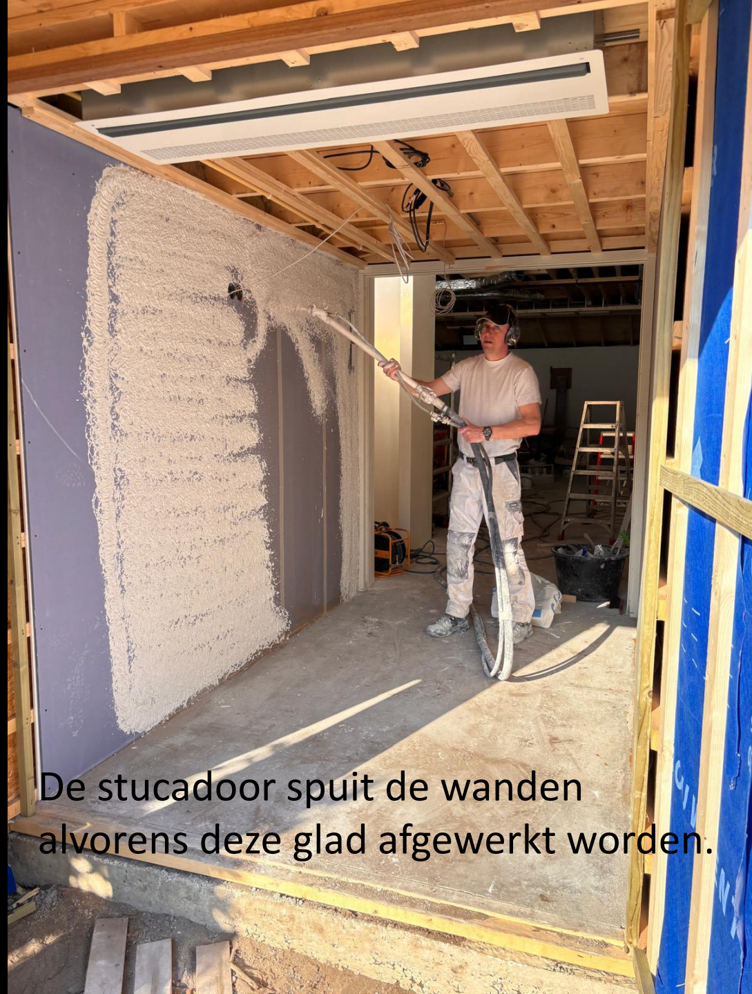
De stucadoor spuit de wanden alvorens deze glad afgewerkt worden.