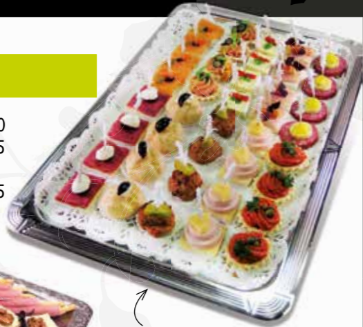
Luxe canapé hapjes

Informeer naar de mogelijkheden, geef ons uw wensen door.