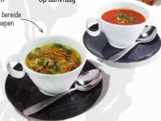
Vers bereide soepen