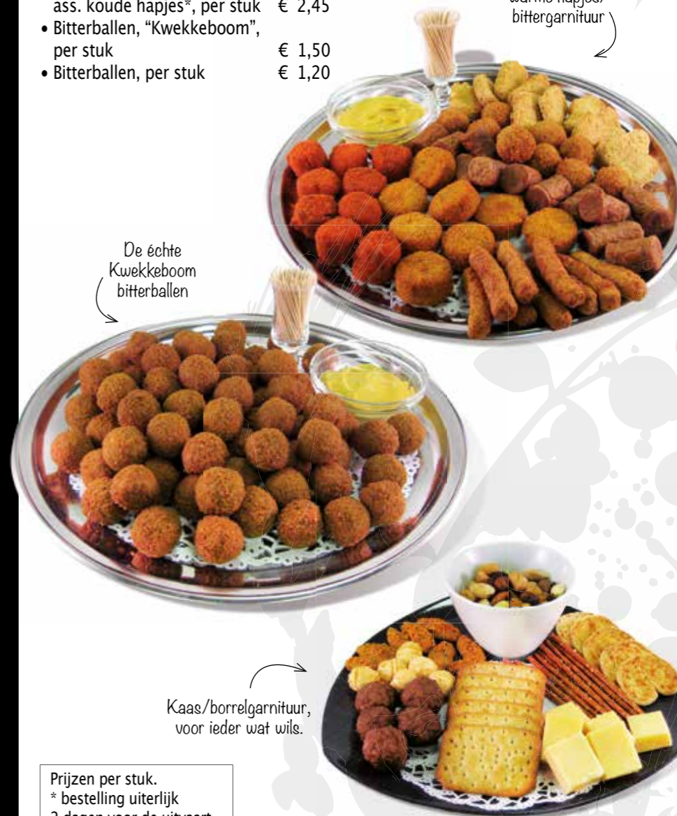
De échte Kwekkeboom bitterballen